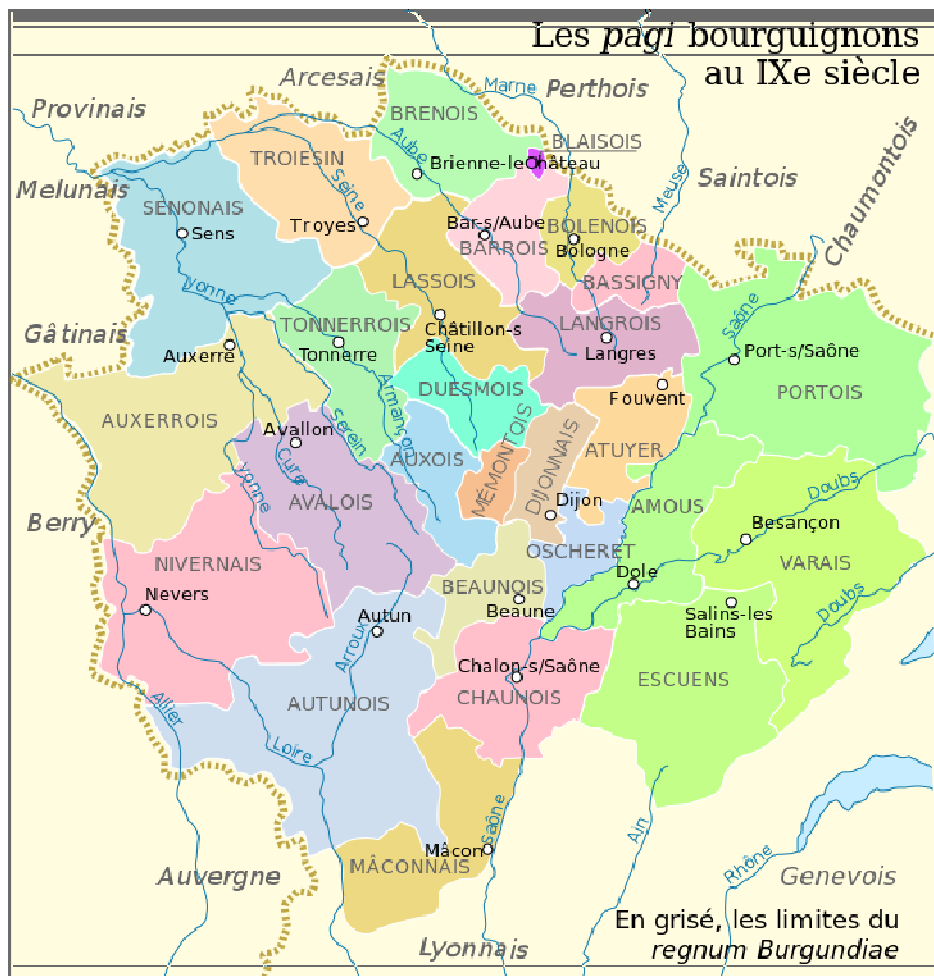
Les pagi bourguignons au IXe siècle, Carte sur laquelle figure le pagus Atuyer.

Zoeken we verder bij de determinaties van Moreau dan komen we de volgende locaties tegen: Pagus Attoariensis : Attouar puis Atuyer (correspondant approximativement aux cantons de Mirebeau-sur-Bèze, Champlitte, Champsevraine, Fontaine-Française et d'Is-sur-Tille) ca,35 km.ten zuiden van Langres en Champigny-les-Langres er vlak bij. De plaatsnamen met Champ- geven toch ook een zekere verwijzing naar de Cham-avi, zeker als je meer op de uitspraak dan op de schrijfwijze let. Op een kaart uit de 9 e eeuw van de ligging van de pagi in Bourgondië (zie kaart hieronder) wordt duidelijk dat we in het oosten van Frankrijk moeten zijn. Daar in Bourgondië ligt Atuyer, naast Amous.